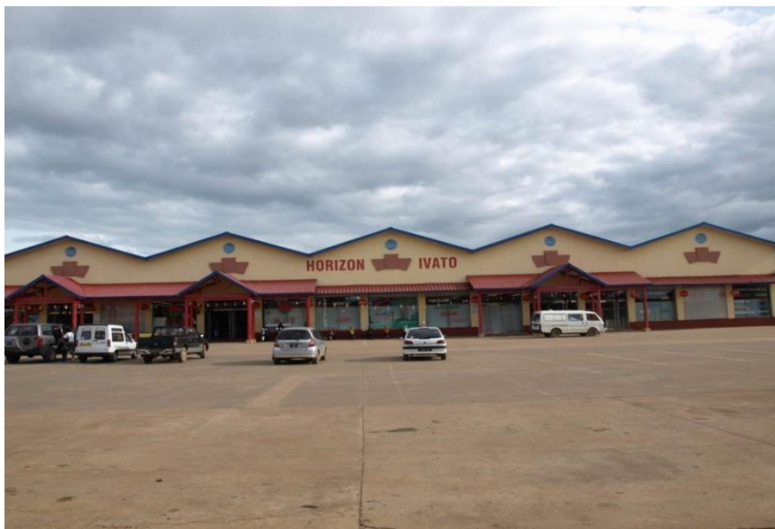
马达加斯加最大的中资企业—华安公司投资的亿万多（IVATO）超市

法国是马达加斯加传统援助国，援助项目主要由法国开发署、法国全球环境基金及法国使馆合作和文化行动处负责。近5年共向马达加斯加提供援款约2.24亿美元，其援助涵盖经济发展、医疗卫生及教育等领域。2017年，法国政府宣布投入2500万欧元（约2946万美元），用于改善伊瓦图和诺西贝两机场的基础设施。法国的援助涉及以下领域：一是基础设施和城市发展。主要项目为塔那市区治理项目。二是农业和环境领域。主要与非政府组织合作，重点项目为PHCF保护森林项目。三是教育和职业教育领域。主要方式为法国企业协会与马国政府部门进行公私合作伙伴关系合作，建设培训中心。