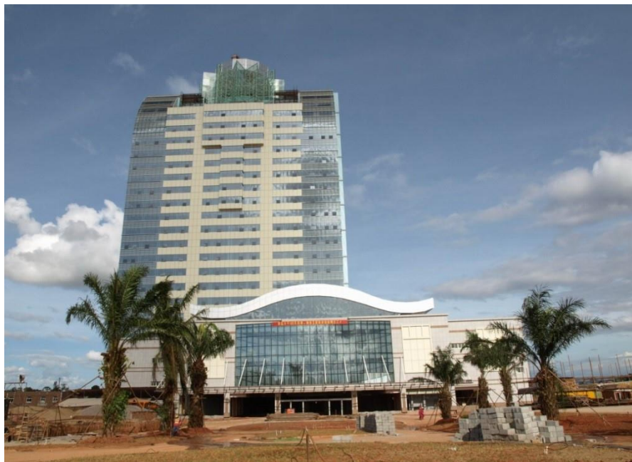
中国公司承建的五星级酒店

【投资】据中国商务部统计，2017年当年中国对马达加斯加直接投资流量7120万美元。截至2017年末，中国对马达加斯加直接投资存量7.66亿美元。主要投资领域涉及矿业、农业、纺织、渔业及房地产。